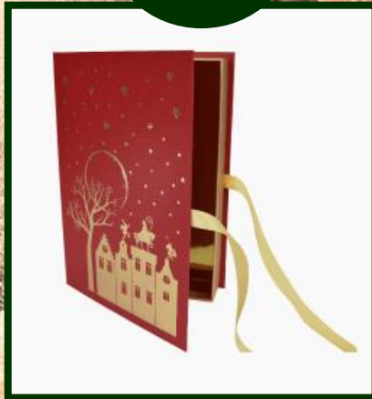
Grote boek van Sint vol lekkers