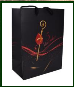
kadotas glanspapier Sint