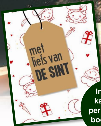
Inclusief kaart met persoonlijke boodschap